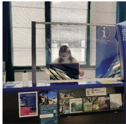
L'info point è rimasto aperto da inizio luglio a fine settembre

C'è voluto coraggio, voglia di mettersi in gioco e passione per il proprio paese per attirare turisti nell'estate del covid: una scommessa che Moltrasio ha sicuramente vinto. Anche quest'anno infatti, nonostante l'emergenza sanitaria, l'Associazione Pro Moltrasio (con il sostegno del Comune) ha attivato l'info point all'imbarcadere in piazza San Rocco, anche se in forma ridotta, studiando unase-