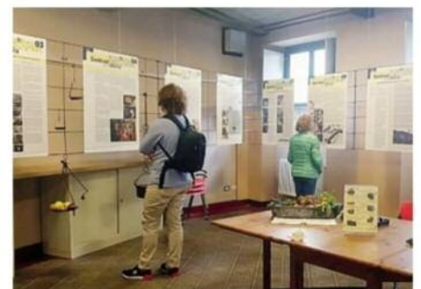
I pannelli allestiti nella sala civica della biblioteca