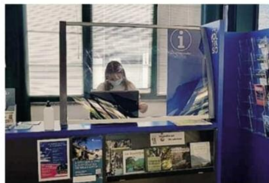
Una vista dell'ufficio turistico di Moltrasio, aperto il fine settimana